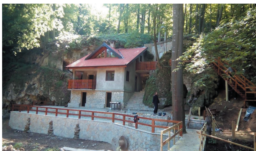
Слика 4. Радови на обнови испоснице

Важно је напоменути и да се манастир налази на мање од два сата возње од Београда, на ободу националног парка Ђердап и само 6 км удаљен од средњовековне тврђаве Голубац.